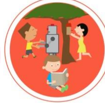
UCZENIE SIĘ PRZEZ ZROZUMIENIE